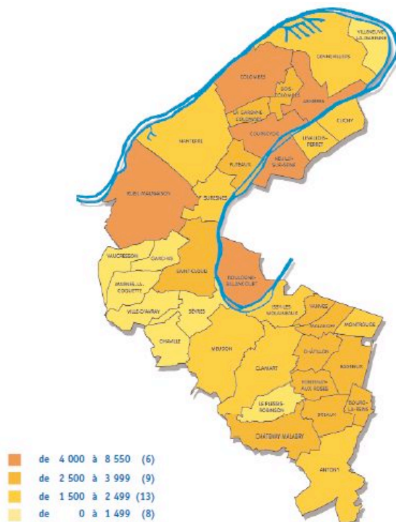
REPARTITION DE LA POPULATION AGEE DE PLUS DE 75 ANS DANS LES HAUTS DE SEINE