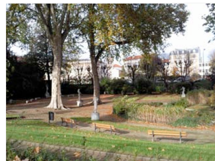
TYPES D'ESPACES VERTS ET REPARTION PAR RAPPORT A LA SURFACE TOTALE

Le tableau présenté ci-contre détaille, pour Asnières, la répartition des espaces verts par « type ». La ligne « Vert diffus » regroupe notamment tous les jardins privatifs. Si l'on se concentre uniquement sur les espaces verts ouverts au public ou d'accès tolérés (cimetière, jardins familiaux, terrains de sports, etc.), la surface d'espaces verts par habitant tombe à 2,43 m 2 par habitant. Cette surface est faible, comparée, par exemple, au 16 m 2 par habitant de la Ville de Malakoff ou au 111 m 2 par habitant de la Ville de Saint-Cloud.